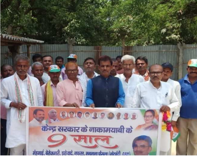
بیگوسرائے میں مرکزی حکومت کی 9 سال کی ناکامیوں پر ضلع کانگریس کمیٹی (آئی بی ایڈ پارٹنمنٹ) کی طرف سے *دھمکے دیوں کے ذریعے شروع کیا گیا۔