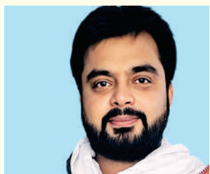
पटना । कांग्रेस दर्पण

याह सिर्फ यात्रा नहीं अश्वमेघ है आपसी नफरत को दूर करने का। यह यात्रा जैसे-जैसे आगे बढ़ रही है, वैसे-वैसे अपनी भव्यता का व्याख्या खुद कर रही है।