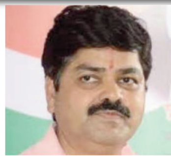
3. गणेश गोदियाल भारत के उत्तराखंड से एक भारतीय राष्ट्रीय कांग्रेस राजनीतिज्ञ हैं। वह थलीसैण विधानसभा क्षेत्र और श्रीनगर विधानसभा क्षेत्र से एक ईमानदार विधायक हैं।