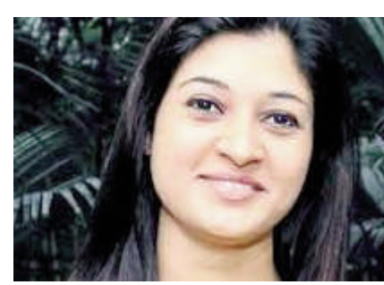
8. अलका लाम्बा दिल्ली विश्वविद्यालय छात्र संघ के पूर्व अध्यक्ष, भारत के राष्ट्रीय छात्र संघ के पूर्व राष्ट्रीय अध्यक्ष, दिल्ली प्रदेश कांग्रेस समिति के पूर्व महासचिव और अखिल भारतीय कांग्रेस कमेटी के पूर्व सचिव हैं।