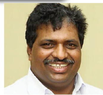
4. कोडिकुनील सुरेश भारत की सोलहवीं लोकसभा में सांसद। 2014 के चुनावों में इन्होंने केरल की मवेलीकार सीट से भारतीय राष्ट्रीय कांग्रेस की ओर से भाग लिया।