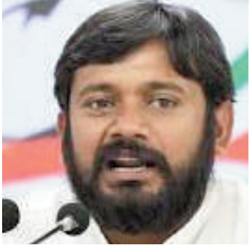
28. कन्हैया कुमार वर्तमान में NSUI का प्रभारी / भारतीय राष्ट्रीय कांग्रेस के नेता हैं। वह 2015 में जेएनयू छात्रसंघ के अध्यक्ष पद के लिए चुने गए थे।