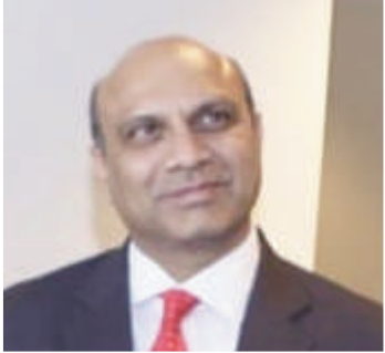
1. एम. एम. पल्लमराजू भारतीय राष्ट्रीय कांग्रेस से संबंधित भारतीय राजनीतिज्ञ हैं। वे 2009 में हुए आमचुनाव में आंध्र प्रदेश के चुनाव क्षेत्र से 15 वीं लोकसभा के लिए सदस्य निर्वाचित हुए हैं। वे पूर्व में कपड़ा मंत्री थे।