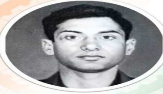
Param Veer Chakra Capt. Manoj Kumar Pandey 25 June 1975 - 3 July 1999