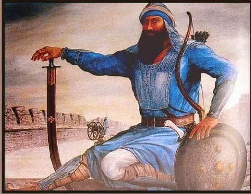
Baba Banda Singh Bahadur Ji Shahidi Diwas

کارگل جنگ کے ہیرو پرم ویر چکر کیپٹن منوج کمار پانڈے کو ان کی یوم پیدائش پر لاکھوں سلام۔ وہ اپنی بہادری اور ثابت قدم قیادت کی وجہ سے ہماری یادوں اور دلوں میں زندہ ہیں۔