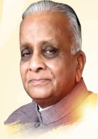
اسام کے بھوتپور وراجستھان کے بھوتپور وراجستھان کے س. شری شिवचरण माथुर जी की पुण्यतिथि पर उन्हें भावपूर्ण श्रद्धांजलि।

ایک بہادر جنگجو اور خالصہ آرمی کے کمانڈر بابا بندہ سنگھ بہادر کو ان کے یوم شہادت پر ہمارا عازانہ خراج عقیدت۔ پنجاب کے اس شیر دل نے انصاف اور غریبوں کو باختیار بنانے کے لیے جدوجہد کی اور اپنی زندگی اپنے لوگوں کے حقوق کے لیے وقف کر دی۔