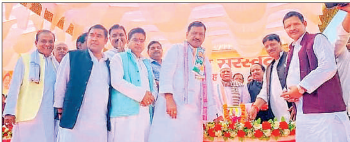
हेमदापुर चक्की, ब्रह्मपुर में किसान आंदोलन के जनक स्वामी सहजानंद सरस्वती जी की 134 वीं जयंती समारोह में शिरकत कर उन्हें स्मरण और नमन किया।