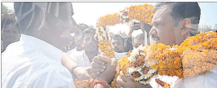
आज पटना से बक्सर जाने के रूत में कार्यकर्ताओं और कांग्रेस परिवार के समर्पित सदस्यों ने जगह-जगह मांय स्वागत और सम्मान किया, इसके लिए आप सभी को बहुत बहुत आभार।

आज ब्रह्मपुर के घोड़-दौड़ मेले का उद्घाटन किया।