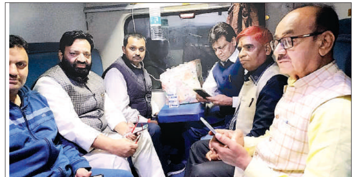
रायपुर छत्तीसगढ़ में आयोजित अखिल भारतीय कांग्रेस कमेटी के राष्ट्रीय अधिवेशन में सम्मिलित होने जा रहा हूँ। दोआ करे कि यात्रा सफल रहे और कांग्रेस के अधिवेशन में कुछ ऐसे प्रस्ताव आए जिससे भारत के नवनिर्माण मदद मिल सके।