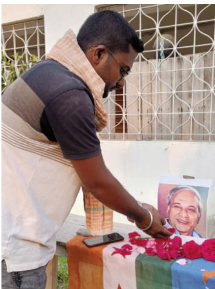
इकांशीराम तेरी नेक कमाई, तूने सोती कौन जगाई।”