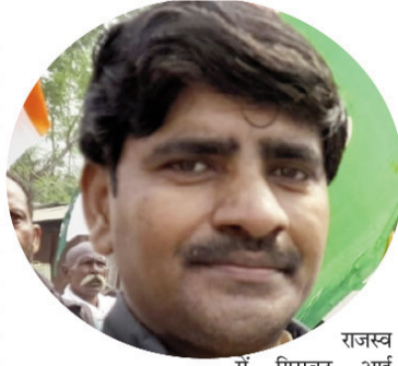
राजस्व में गिरावट आई

फरवरी महीने में 1.49 लाख करोड़ रिकॉर्ड जीएसटी वसूली हुई यह लगातार 12 वें माह रिकॉर्ड संग्रह का प्रमाण है जीएसटी संग्रह फरवरी में घरेलू आर्थिक गतिविधियों और उपभोक्ता खर्च में वृद्धि के बल पर 12% बढ़कर 1.49 लाख करोड़ रुपये हो गए इसके साथ ही उपकर संग्रह जीएसटी लागू होने के बाद अपने सर्वोच्च स्तर पर पहुंच गया है यह लगातार 12वां महीना है जब जीएसटी का मासिक राजस्व 1.40 लाख करोड़ से अधिक रहा है। एक साल पहले के समान महीने में जीएसटी संग्रह 133000 करोड़ रुपये रहा था इस तरह फरवरी 2023 में जीएसटी कर संग्रह सालाना आधार पर 12% बढ़ा है जिसमें बिहार 12% से अधिक अर्थात् 24% का योगदान दिया हालांकि फरवरी में जीएसटी