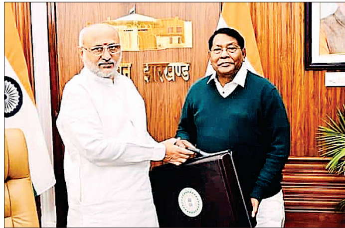
राज्यपाल माननीय श्री सी पी राधाकृष्णन जी को सदन में पेश किए जाने वाले वित्तीय वर्ष 2023-24 बजट की प्रति सौपते हुए वित्त मंत्री श्री डॉ रामेश्वर उरांव जी।