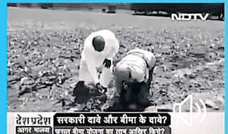
देश प्रदेश सरकारी बावे और बीमा के बावे? अगर मालवी अन्न बीमा योजना का लाभ अधिकरिने?

कमी 500 किलो प्याज बेचने पर 2 रुपए का चेक, तो कमी प्याज की खड़ी फसल पर ट्रैक्टर चलाने को मजबूर किसान...कहीं टमाटर को सड़क पर फेंकता किसान तो कहीं फसल बीमा की रकम का इंतजार करता किसान...इसब के राज में अन्नदाता मोहताज हो गया है- अपनी ही फसल के सही दाम के लिए।