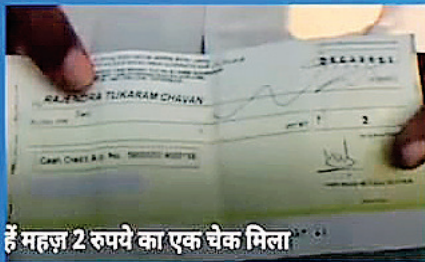
हैं महज़ 2 रुपये का एक चेक मिला

झारखण्ड माल और सेवा कर अधिनियम, 2017 की धारा- 96 के अन्तर्गत झारखण्ड अग्रिम विनिर्णय प्राधिकरण (Jharkhand Authority of Advance Ruling) के गठन से संबंधित अधिसूचना में संशोधन संबंधी अधिसूचना निर्गमन की स्वीकृति