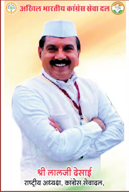
अखिल भारतीय कांग्रेस सेवा दल