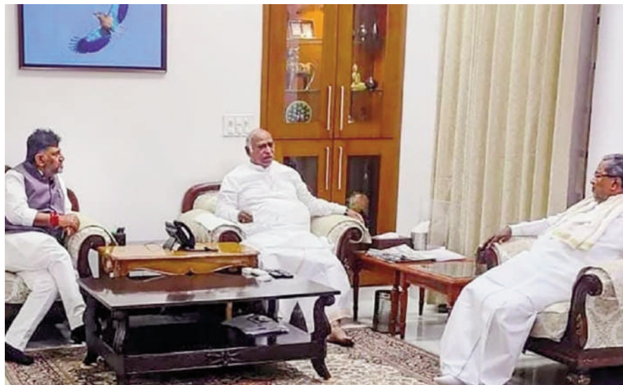
रणदीप सुरजेवाला से सोमवार देर रात चर्चा की।

कांग्रेस की तरफ से नियुक्त किए गए तीनों पर्यवेक्षकों ने अगले मुख्यमंत्री को लेकर विधायकों की राय जानी। इसके लिए विधायकों से गुप्त मतदान भी कराया गया। इस रिपोर्ट को लेकर तीनों पर्यवेक्षक सुबह करीब 10 बजे दिल्ली के लिए रवाना हुए और वहां कांग्रेस अध्यक्ष को रिपोर्ट सौंपी। मल्लिकार्जुन खरगे ने रिपोर्ट को लेकर पार्टी महासचिव केसी वेणुगोपाल और कर्नाटक प्रभारी