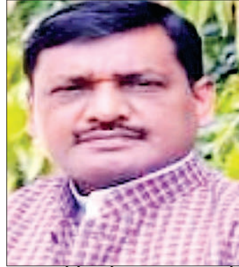
राहुल गांधी के नेतृत्व से किस कदर प्रधानमंत्री नरेंद्र मोदी और भाजपा चबड़ाई हुई है। तानाशाही से लोकतंत्र