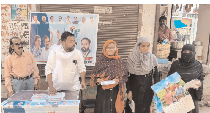
#हाथ—से—हाथ—जोड़े—कार्यक्रम के तहत शहर फतेहपुर में वाई नंबर 29 नी के लोगो को आदरणीय सहूल गांधी जी आदरणीय प्रियंका गांधी जी के संदेश पर लोगो तक दिए गए