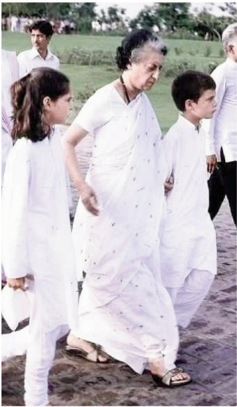
निन्हें चलना ही इंदिरा जी ने सिखाया हो, उन्हें तुम खाक डराओगे...