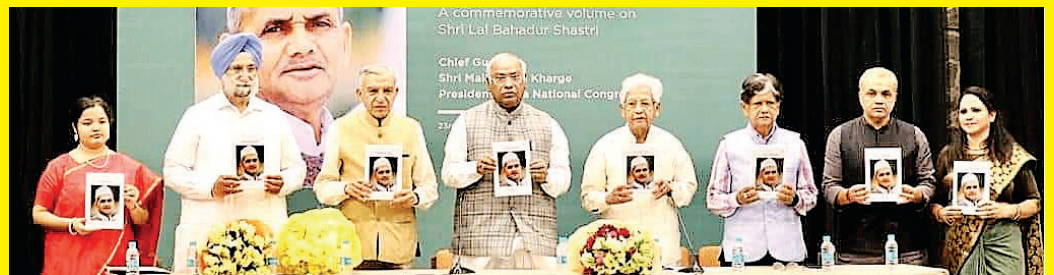
कांग्रेस अध्यक्ष श्री Mallikarjun Kharge ने 'Son of the Soil' बुक की लॉन्चिंग के मौके पर सादगी की प्रतिमूर्ति पूर्व प्रधानमंत्री लाल बहादूर शास्त्री के चित्र पर पुष्प अर्पित कर उन्हें भावपूर्ण श्रद्धांजलि दी। पूज्य शास्त्री जी ने भूमि सुधार, दुग्ध श्रमिता, हरित श्रमिता की नींव रखी.. रेलवे में थर्ड क्लास को खत्म कर महिलाओं के लिए बस में सीट का प्रावधान दिया।