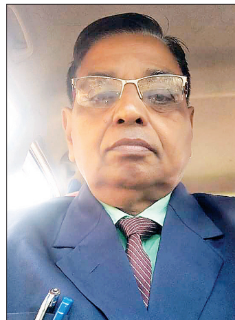
भारत में एक मात्र राहुल गांधी जी ही ऐसे नेता हैं जो सिर्फ सत्य ही बोलते हैं और बिना लाग लपेट सीधे सीधे बोलते हैं। सत्य में अपार शक्ति होती है इस तथ्य को

वर्तमान मोदी सरकार के समय में भारत की एक भी संवैधानिक संस्थान नहीं है जिसपर प्रत्यक्ष या परोक्ष रूप से मोदी जी का नियंत्रण नहीं है। सर्वोच्च न्यायालय के न्यायाधीश अवकाश ग्रहण करते हैं और बड़े बड़े पदों पर आसीन करा दिए जाते हैं, चुनाव आयोग कठपुतली की तरह नाच रही है, भ्रष्टाचार में आकंट डुबे भाजपाई मौज कर रहे हैं तो ईडी और सीबीआई चुन चुन कर विरोधियों को निशाना बना रही है डराने धमकाने का प्रयास कर रही है। क्या यही भारतीय लोकतंत्र है? यही तो राहुल गांधी जी ने कहा।