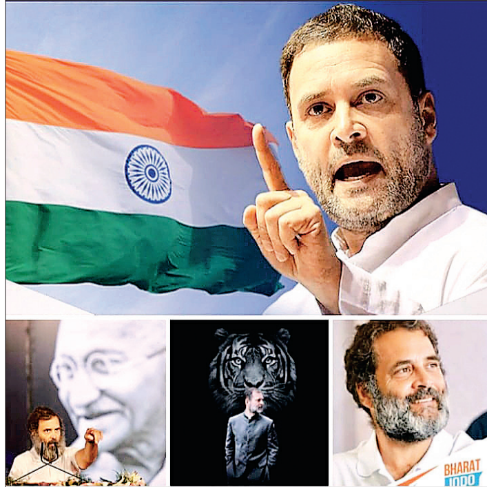
आवाज बुलंद करने से देश की सत्ता पर काबिज मोदी सरकार को आगामी लोकसभा चुनाव में हार की डर