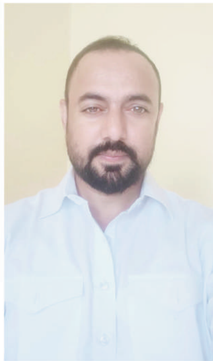
आकर्षित करवाया गया था।

बिहार सरकार जिस प्रकार से हर क्षेत्र में अच्छा काम कर रही है, वो कृषि के प्रति भी गंभीर है इसलिए समिति का गठन किया