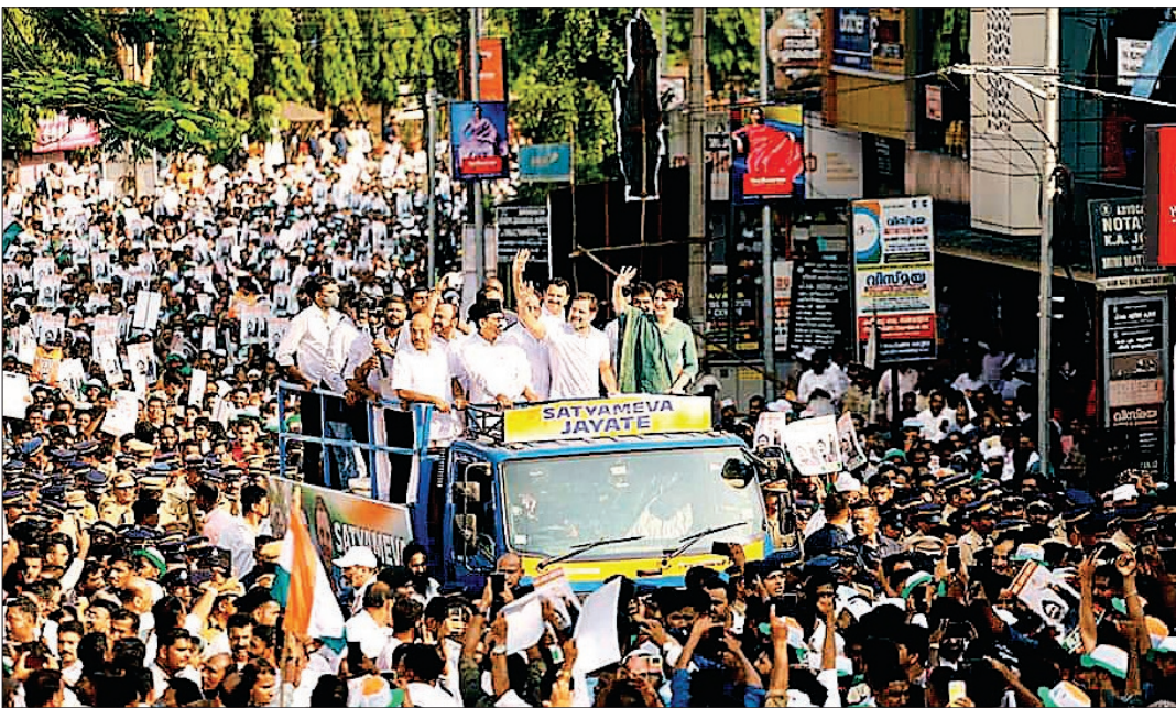
केरल के वायनाड में राहुल गांधी जी और प्रियंका गांधी वाड़ा जी की जनसंपर्क रैली

आज पूरी सरकार, सारे मंत्री, सारा सिस्टम एक व्यक्ति-राहुल गांधी पर हमला करने के लिए लगा दिया गया है क्योंकि वे ऐसे सवाल पूछ रहे हैं जिसका यह सरकार जवाब नहीं दे सकती। जो झूठ बोलते हैं, सच उन्हें हमेशा विचलित करता है लेकिन हमारा देश सत्य, अहिंसा और न्याय की बुनियाद पर खड़ा हुआ है। हमारी लड़ाई सत्य के लिए है और सत्य ही विजयी होगा।