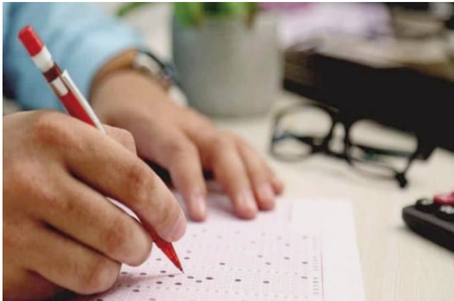
उम्मीदवारों का कल्याण एकमात्र चिंता 24 लाख NEET गांधी ने मंगलवार को प्रधानमंत्री को

नई दिल्ली लोकसभा में नेता प्रतिपक्ष राहुल गांधी ने मंगलवार को प्रधानमंत्री नरेन्द्र मोदी को पत्र लिखकर आग्रह किया कि मेडिकल प्रवेश परीक्षा 'नीट' में कथित अनियमितता के मुद्दे पर सदन में चर्चा कराई जाए। उन्होंने कहा कि राष्ट्रीय पात्रता सह प्रवेश परीक्षा (नीट) पर चर्चा कराने के विपक्ष के अनुरोध को गत 28 जून और बीते सोमवार को टुकरा दिया गया था, लेकिन लोकसभा अध्यक्ष ओम बिरला ने विपक्ष को आश्वासन दिया था कि वह सरकार के साथ इस मामले पर चर्चा करेंगे।