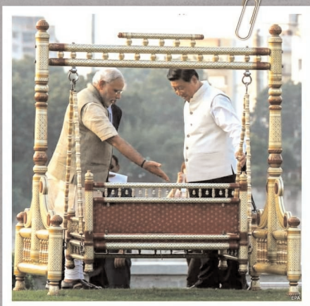
पहले आप, बड़ी इकॉनमी