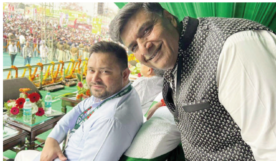
पूर्णिमा(बिहार) में हुई #महागठबंधन की रैली में बिहार कांग्रेस अध्यक्ष व राज्यसभा सांसद Dr Akhilesh Prasad Singh जी के साथ सम्मिलित हुआ। इस दौरान बिहार मुख्यमंत्री श्री नीतीश कुमार जी व उपमुख्यमंत्री श्री Tejashwi Yadav जी से मेंट हुई!