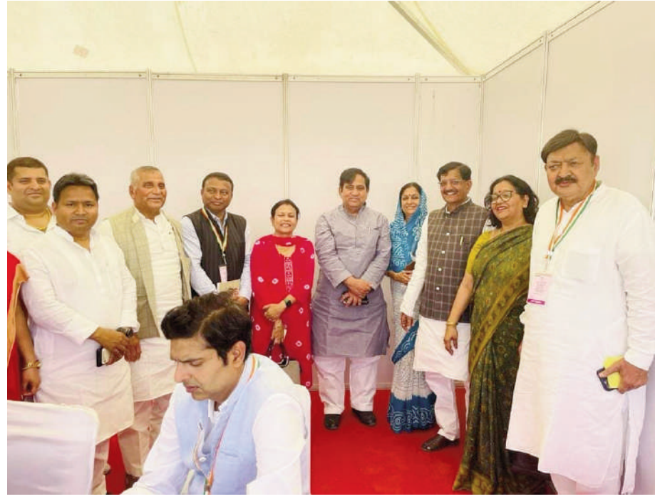
छत्तीसगढ़ की राजधानी रायपुर से लगभग 18 किलोमीटर के दूरी पर नवा रायपुर में संपन्न भारतीय राष्ट्रीय कांग्रेस के 85वें अधिवेशन की कुछ झलकियां।