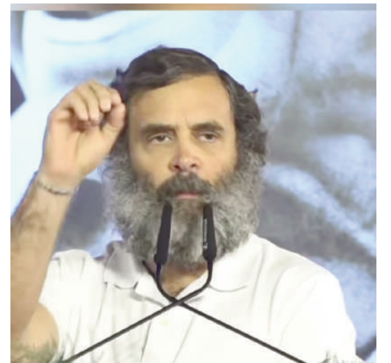
राहुल गांधी ---

'मोडानी' की सच्चाई निकलने तक नहीं रुकेंगे, देश विरोधी ताकतों से जमकर लड़ेंगे।