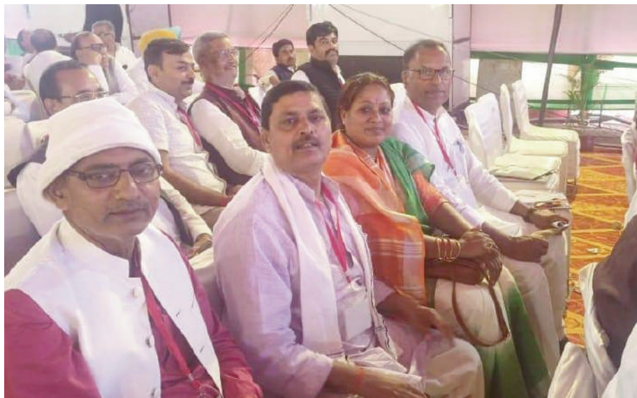
भारतीय राष्ट्रीय कांग्रेस के 85वां महाधिवेशन में शामिल हुए।