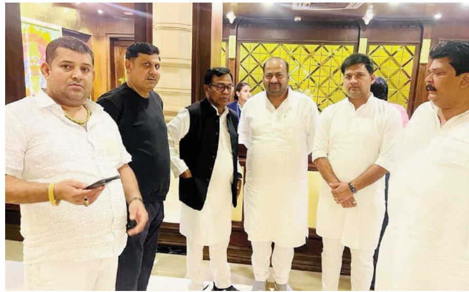
कांग्रेस महाधिवेशन में