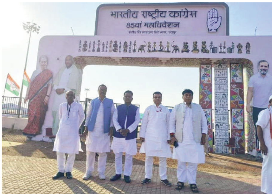
कांग्रेस महाधिवेशन में